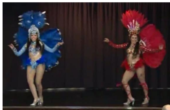
Dançarinas de samba na inauguração do novo curso de português

A expansão das atividades do CCBL foi planejada ao longo de 2015, quando a Embaixada buscou identificar instituições potencialmente interessadas em acolher curso de português fora de Beirute. A parceria com a municipalidade de Zouk Mikael mostrou-se a mais conveniente. O município dispôs de uma sala de aula gratuitamente para a oferta de turma experimental de português no Centro da Juventude e Cultura ("Maison des Jeunes et de la Culture").