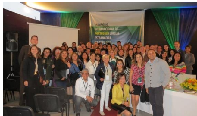
Celebração dos 40 anos do Centro Cultural Brasil-México

Não faltaram caipirinha e comidas típicas nacionais para os presentes, servidos por meio de um food truck instalado no pátio do Centro. Artistas gráficos do grupo Latinta Mural expuseram obras elaboradas ao longo do dia, no próprio Centro Cultural. Cerca de 150 pessoas compareceram ao evento. O CCBM foi a nona unidade da Rede Brasil Cultural a ser criada no mundo, em 1975. Atualmente, conta com mais de 300 alunos.