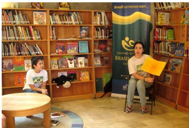
Sessão de 'contação de histórias' no Café Literário Bustamante

Uma pequena maratona de contos brasileiros, narrados, lidos ou apresentados de forma teatral, foi conduzida pelo Centro Cultural Brasil-Chile (CCBRACH) em Providencia, na grande Santiago, no contexto do projeto "Conta Contos", que envolveu este ano duas apresentações, realizadas nos dias 9 e 23 de janeiro, no Café Literário Bustamante.